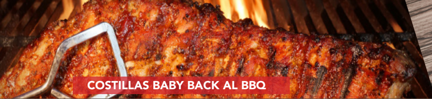
COSTILLAS BABY BACK AL BBQ