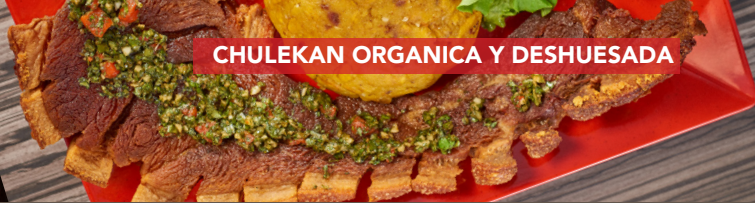
CHULEKAN ORGANICA Y DESHUESADA