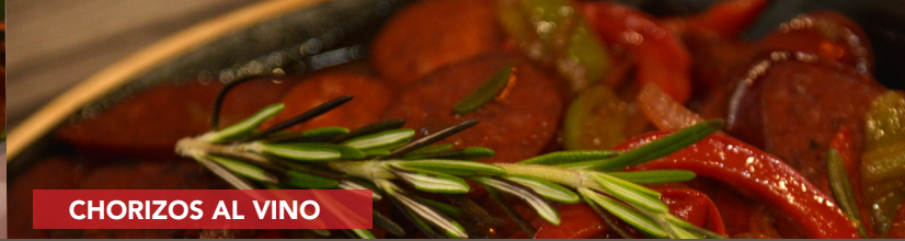
CHORIZOS AL VINO