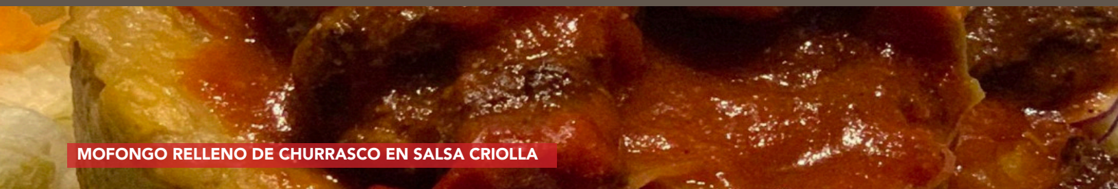
MOFONGO RELLENO DE CHURRASCO EN SALSA CRIOLLA