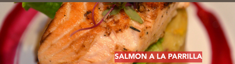
SALMON A LA PARRILLA